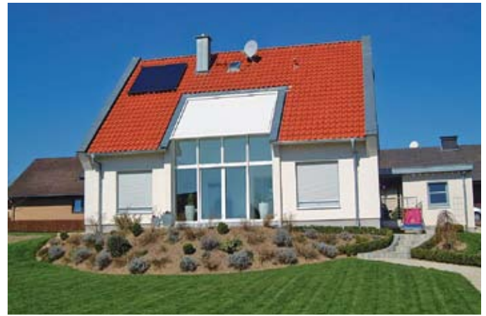
Klassisches Einfamilienhaus in Massivbauweise