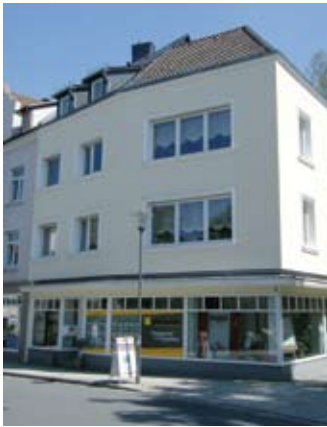
Umbau eines Wohn-/Geschäftshauses